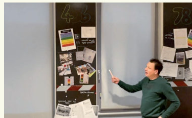
Teamleden presenteren de doorgaande lijn rondom zelfstandig werken.