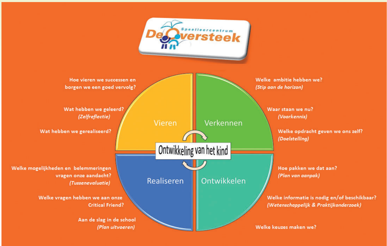
De ontwikkelcirkel van De Oversteek.