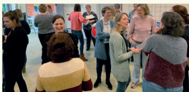
Leren van en met elkaar tijdens een feedbackronde op de ontworpen nieuwe proeftuinperiode die gericht was op het vergroten van de coachende rol van de leraar in ieder cluster.

“Het team is zichtbaar gegroeid in het reflecteren en feedback geven op elkaars handelen als het gaat om het geven van richting, ruimte en ruggensteun aan de kinderen. Hier geeft men op een constructieve en opbouwende manier tijdens de studiebijeenkomsten met mij steeds een vervolg aan. Er melden zich nu spontaan leerkrachten aan die met mij samen willen gaan observeren bij collega's. Het leren van en met elkaar is voor mij een enorm belangrijke waarde in het leven en dus ook in mijn werk en ik vind het heel mooi als een team dit steeds meer gaat doen en zich hiervoor openstelt. Dat komt echt ten goede aan het onderwijs voor de kinderen.”