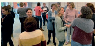
Leren van en met elkaar tijdens een feedbackronde op de ontworpen nieuwe proeftuinperiode die gericht was op het vergroten van de coachende rol van de leraar in ieder cluster.

“Het team is zichtbaar gegroeid in het reflecteren en feedback geven op elkaars handelen als het gaat om het geven van richting, ruimte en ruggensteun aan de kinderen. Hier geeft men op een constructieve en opbouwende manier tijdens de studiebijeenkomsten met mij steeds een vervolg aan. Er melden zich nu spontaan leerkrachten aan die met mij samen willen gaan observeren bij collega's. Het leren van en met elkaar is voor mij een enorm belangrijke waarde in het leven en dus ook in mijn werk en ik vind het heel mooi als een team dit steeds meer gaat doen en zich hiervoor openstelt. Dat komt echt ten goede aan het onderwijs voor de kinderen.”