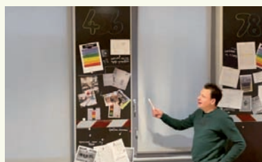
Teamleden presenteren de doorgaande lijn rondom zelfstandig werken.