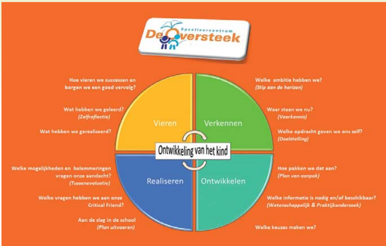
De ontwikkelcirkel van De Oversteek.